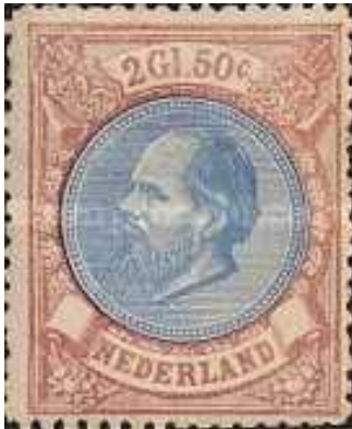
2 Koning Willem III NVPH 29 uit serie 1872-1888