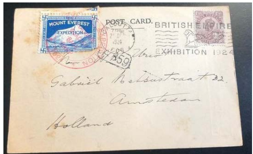
India brief met spec. Stempel British Empire Exhibition 1924 En speciaal Mount Everest postzegel

De burgers in India die in de nabijheid wonen van de wereldberoemde bergketen Himalaya met de hoogste top ter wereld, Mount Everest 8848 m, kunnen genoemde bergketen eindelijk weer zien. De enorme smog die er de laatste decennia hing is vrijwel verdwenen dankzij de lock down als gevolg van de Corona crisis.