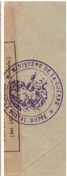
2 Achterzijde censuurstempel