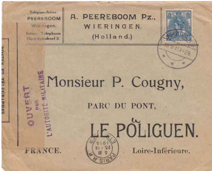
1 Brief verstuurd vanuit Hippolytushoef naar Frankrijk. Dat ging via Engeland, met censuur in Dieppe.