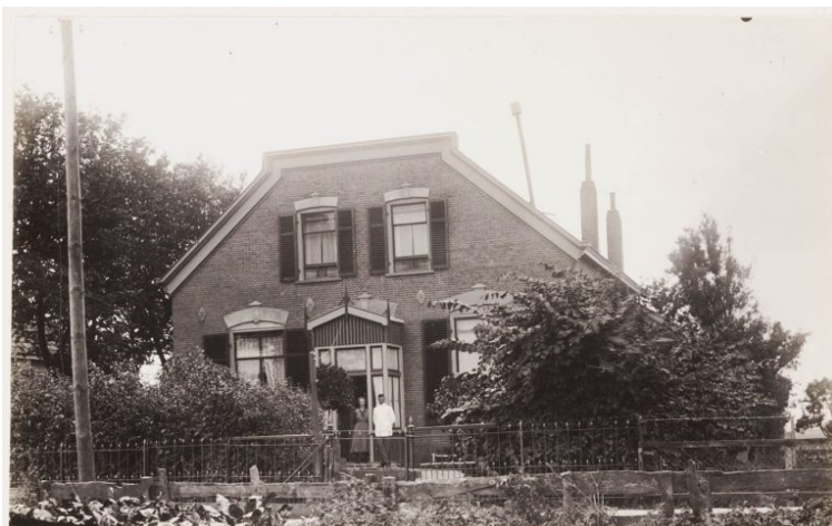
Wieringen Pastorie Oosterland Verblijfplaats Duitse Kroonprins 1918-1923.