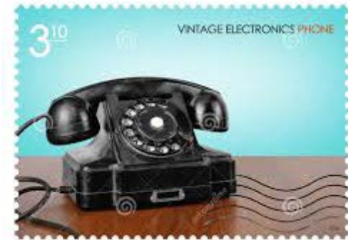
4 Telefoon rond 1940-45

“ 1940 --- 12 mei. Op deze dag meldt zich een Duits officier die zowel in het postkantoor als in het Paleis de telefooninstallatie controleert en buiten bedrijf stelt.” einde citaat